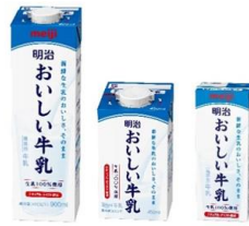
「明治おいしい牛乳」