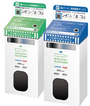
＜資源循環ボックスイメージ＞